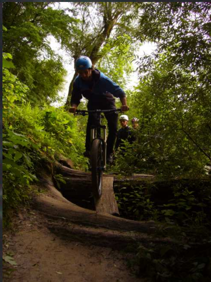
Vielfalt in der City – der Meister an der Schlüsselstelle

Der Startpunkt wurde so gewählt, daß die Mehrzahl der Teilnehmer eine kurze Anfahrt hatte. Die Strecke führte uns auf ca. 30 km Länge, aber ohne nennenswerte Höhenmeter auf Radwegen und Trails durch das Stadtgebiet Münchens. Dabei bestand an technischen Schlüsselstellen verschiedenster Couleur die Möglichkeit, die persönliche Fahrtechnik zu üben und die Grenzen des eigenen Fahrkönnens auszuloten und zu verschieben. Der konditionelle Anspruch ist aufgrund der verwinkelten Trails mit vielen kleinen und großen Hindernissen als mittel bis hoch zu beschreiben.